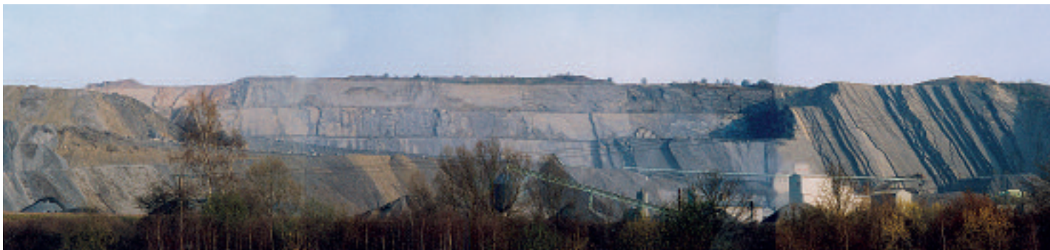
► La falaise de Givet : cette carrière de pierre bleue fournit un calcaire dur actuellement employé pour le ballast de la ligne du TGV. Ce site ardennais est l'un des deux seuls embranchés fer dans la région.